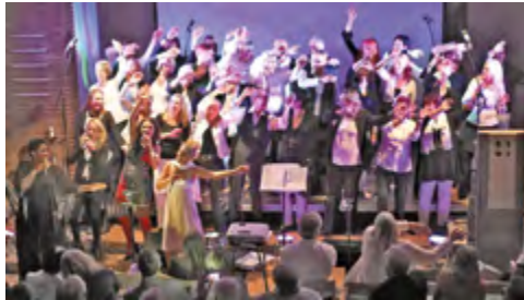
Wings of Faith