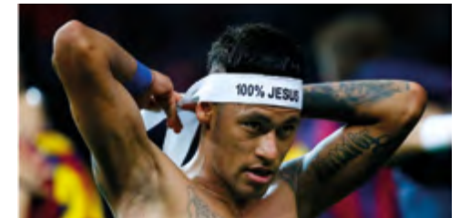
Ein Bild sagt mehr als viele Worte – Neymar nach dem Champions-League-Finale 2015

Fußball-Dramatik gemeinsam erleben und genießen – im WM-Studio des Gemeinschaftshauses Brackel