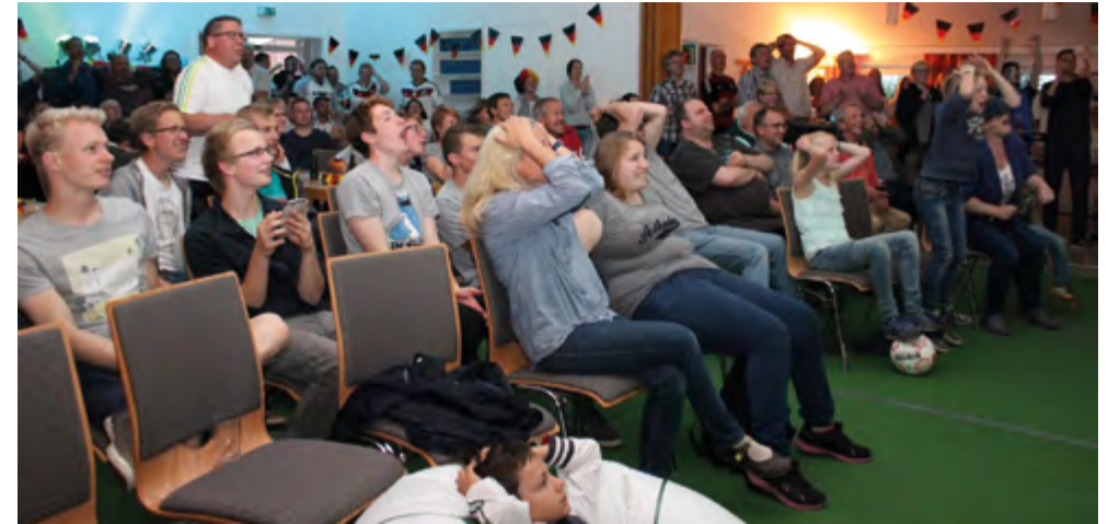
Fußball ohne WM-Studio im Gemeinschaftshaus ist nur halb so schön.

17. Juni bis 15. Juli: Public Viewing zur Fußball-Weltmeisterschaft im Gemeinschaftshaus Brackel