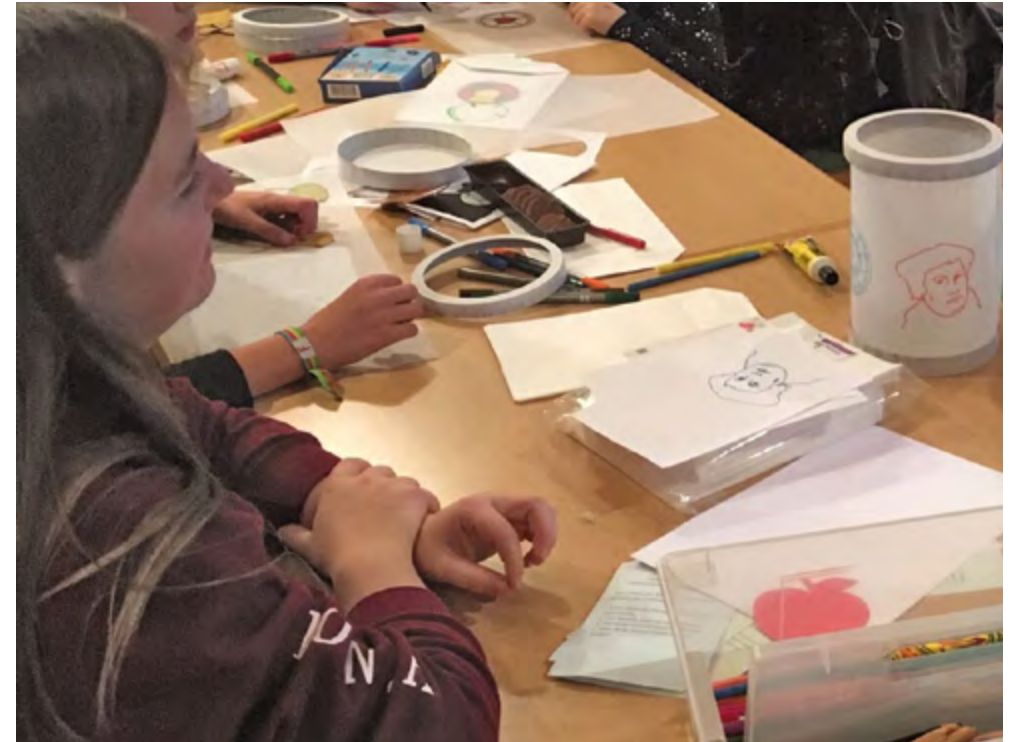
Luther wird zum Leuchten gebracht