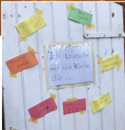
Wünsche für die Kirche von morgen