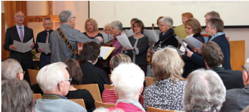
Der Projektchor mit einer Mischung alter und neuer Lieder