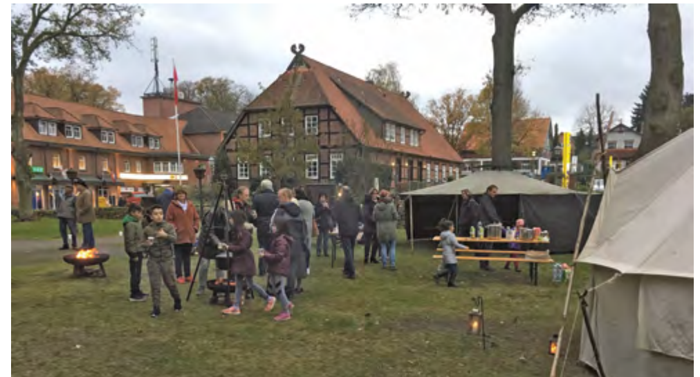
Leckeres und Warmes auf dem Zeltplatz