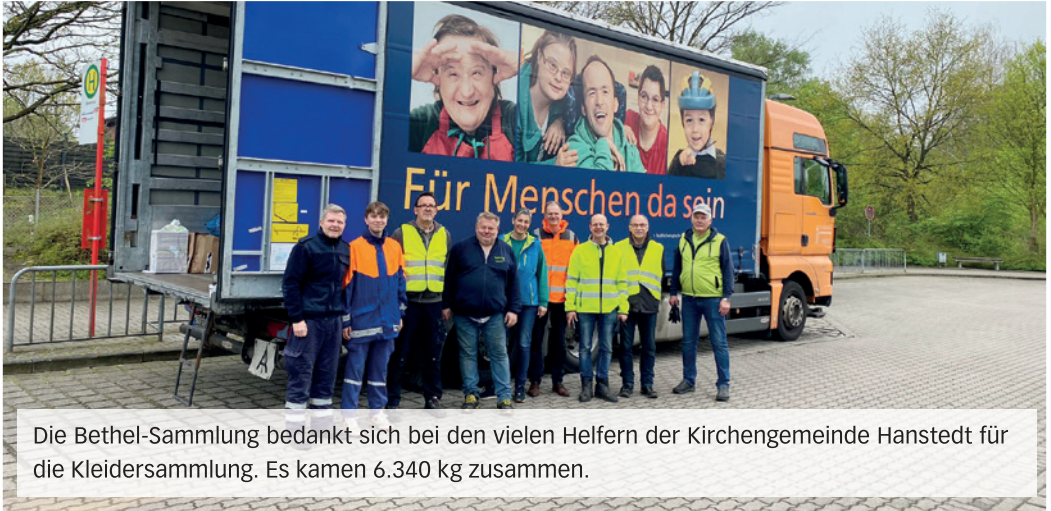
Die Bethel-Sammlung bedankt sich bei den vielen Helfern der Kirchengemeinde Hanstedt für die Kleidersammlung. Es kamen 6.340 kg zusammen.